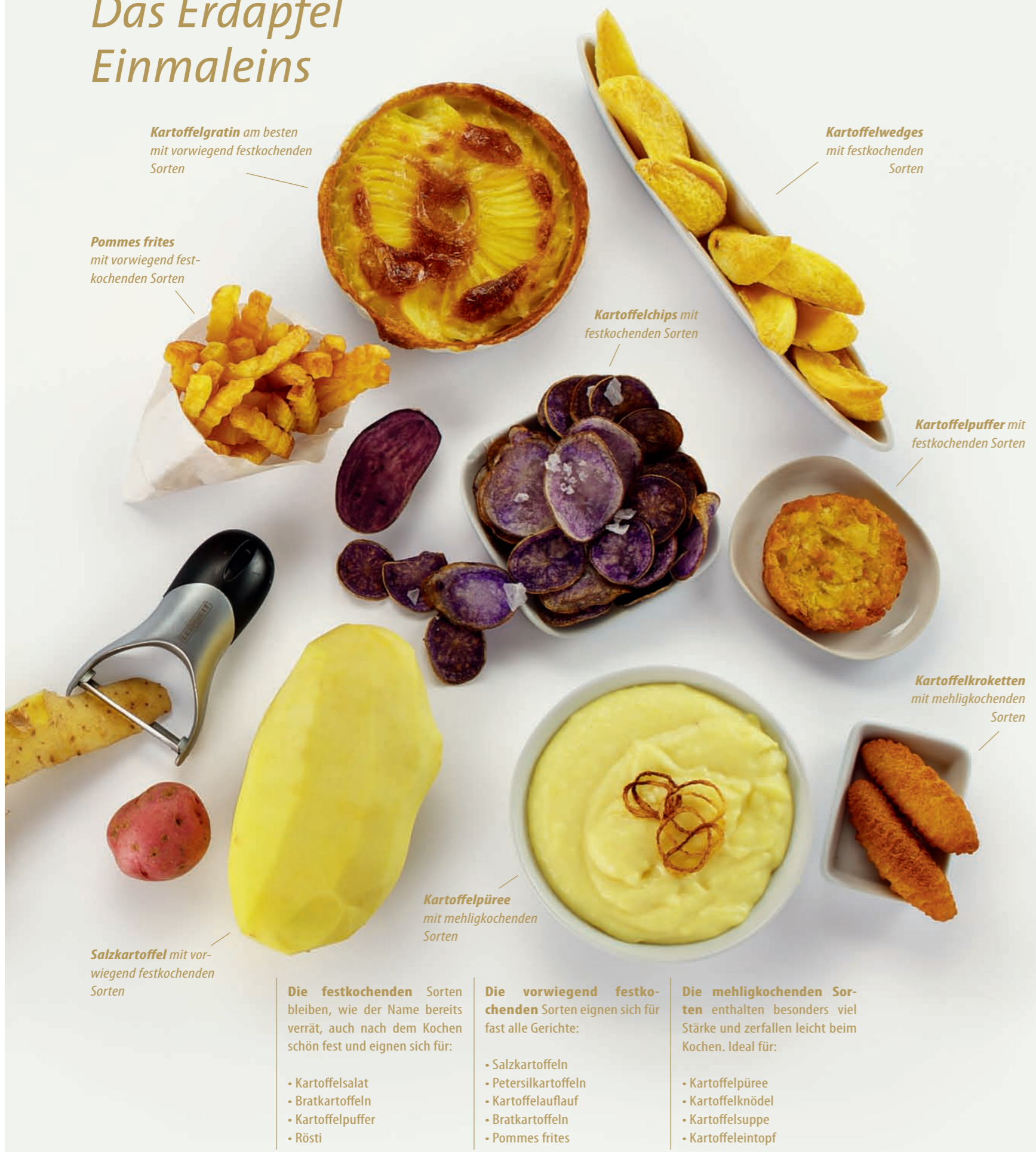
Kartoffelgratin am besten mit vorwiegend festkochenden Sorten